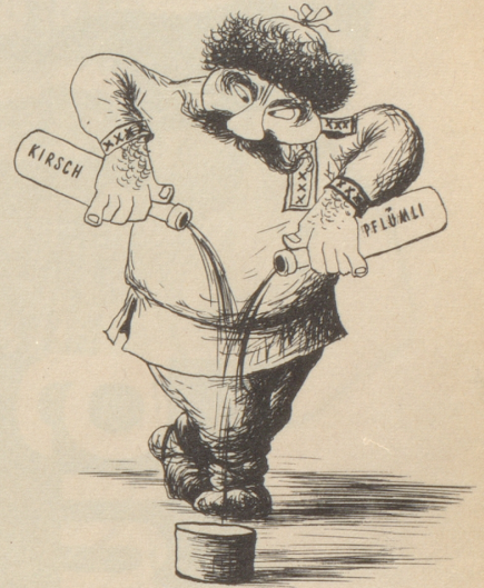
Sergej Spiritusewitsch Spiritusow aus Tula, der Erfinder des Liköres