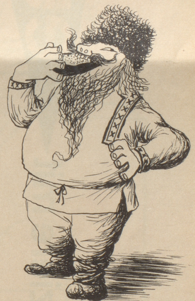
Aleksey Kornowitsch Brotow aus Nischni-Nowgorod, der größte Wohltäter der Menschheit, Erfinder des Brotes