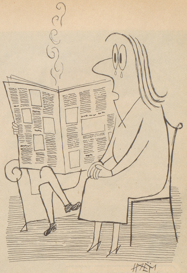
« Mängmal han ich s Gefühl ich sig nid verheiratet! »