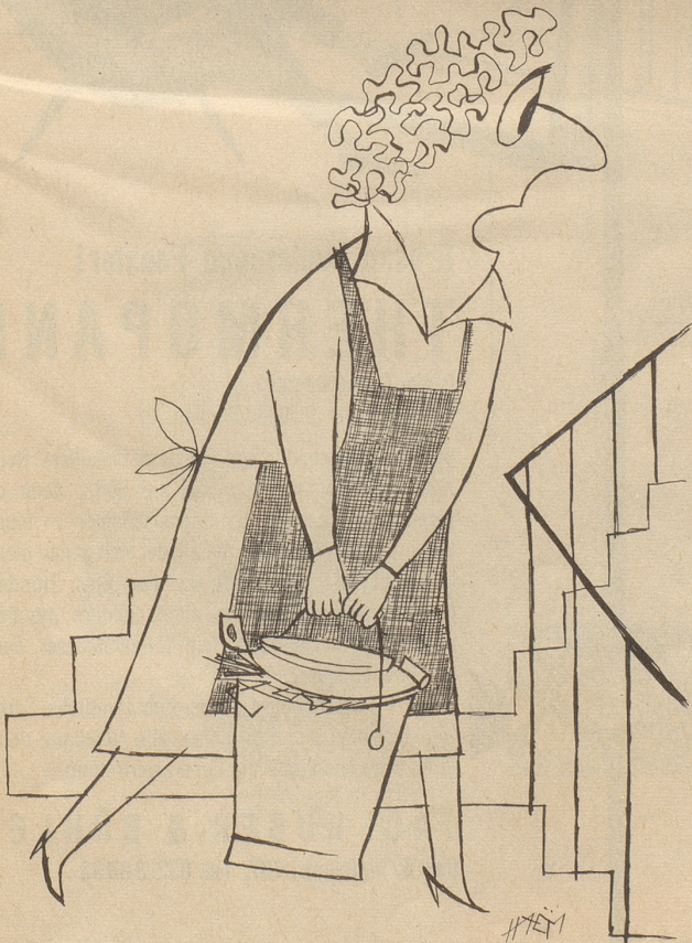
« Zerscht isch er drüber gheit und dänn hät er en la schtaa! »