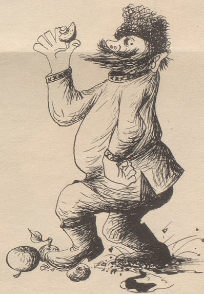
Marmeladow, Entdecker und Vorkämpfer für zerkleinertes Obst

Zu einem Landarzt der Innerschweiz kam ein Bauer und zeigte dem Dorfmedicus seinen Arm, den er sich bei einem Sturz vom Baum arg zerschunden hatte. Dem Doktor blieb nichts anderes übrig, als die tiefe Wunde zu nähen. Als er während seiner Arbeit einmal aufschaute, sah er, wie der Patient vor Schmerz fest auf die Zähne biß. «Tuets weh?» fragte er den Bauer. «Ä paar Schtichli gend no, aber es ganzes Chleid wetti nid von Ech!» war die Antwort. Cos.