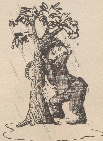
Pjotr Aufspannow Regenschirmowitsch aus Uspekistan, der Erfinder des Regenschirmes