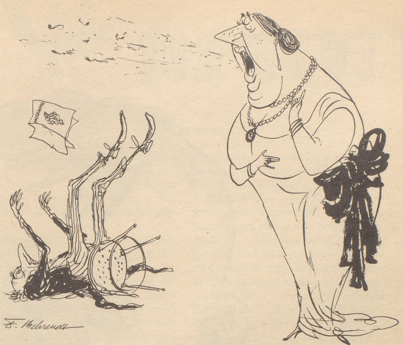
DAS war zuviel!

Die Porzellanfiguren sind beim Fall zerbrochen, der Regenschirm verschwunden, wahrscheinlich einem Sammler als besonders schönes Stück aufgefallen. Die Straßenjungen teilen sich in die Weintrauben und verkaufen die Zeitungen ein zweites Mal. Doch der arme Mann, dessen Identität man feststellen will, hält in der krampfhaft geschlossenen Hand ein geheimnisvolles Papier, dem der hilfreiche Apotheker entnimmt, daß er im Restaurant <Coquillère> für fünf Francs siebzig zwei Fleischgänge, einen Gemüsegang nach Wahl, Obst, Käse, schwarzen Kaffee mit Kognak und einen Viertel Rotwein haben kann. (Uebersetzt von n. o. s.)