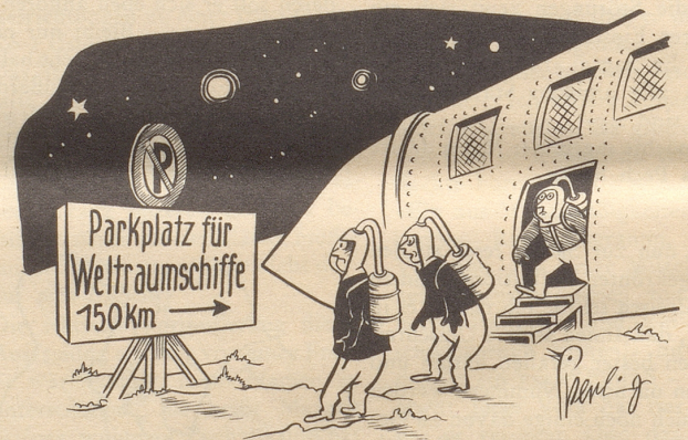
«Das glaubt uns unten kein Mensch! ...»

Hitzewunsch eines Touristen: Mit dem neugewählten Präsidenten der Republik in die Wüste gehen, damit der Nasser trockner wird. bi