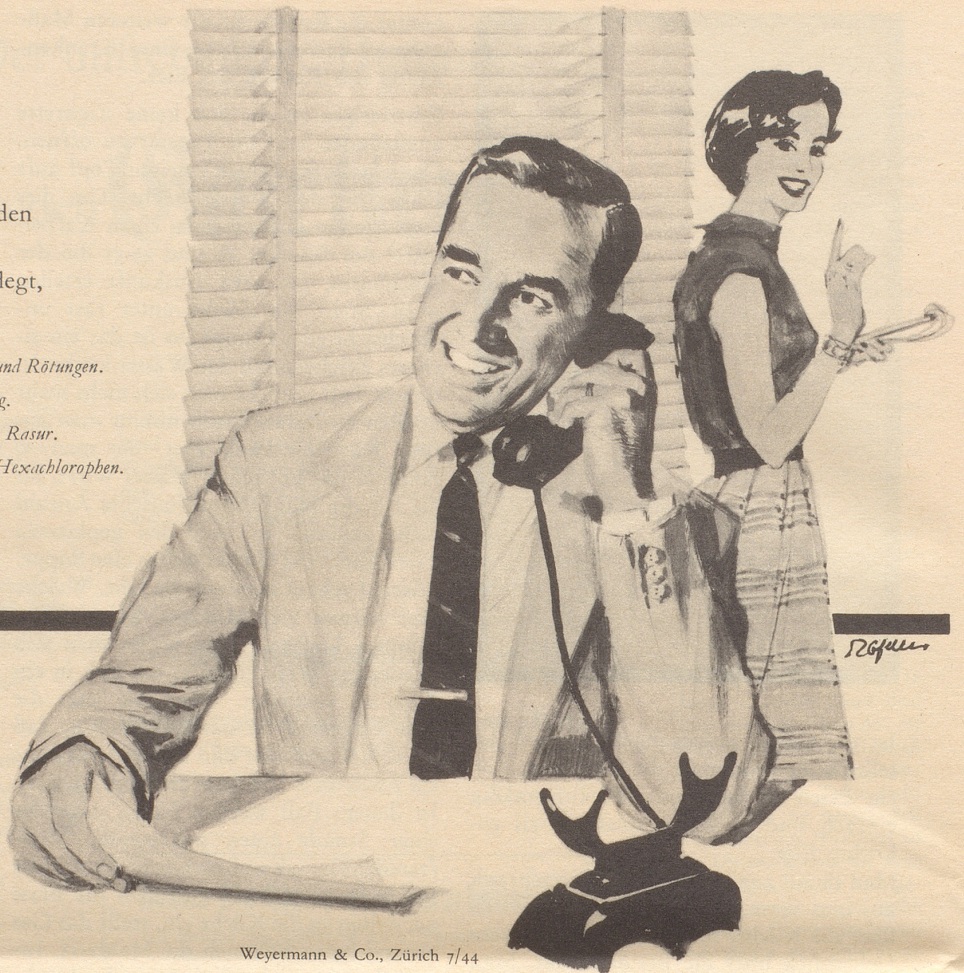
Weyermann & Co., Zürich 7/44