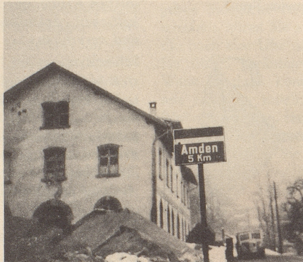
Von Amden nach Weesen zurück aber

Als langjähriger und eifriger Leser bitte ich Dich um Deine Beihilfe. Ich habe bei einer Fahrt nach Amden trotz hellem Sonnenschein einen Nebel entdeckt, den ich ohne Dich nicht wegbringen kann. Laut den angebrachten offiziellen Ortstafeln ist nämlich die Distanz von Weesen nach Amden: