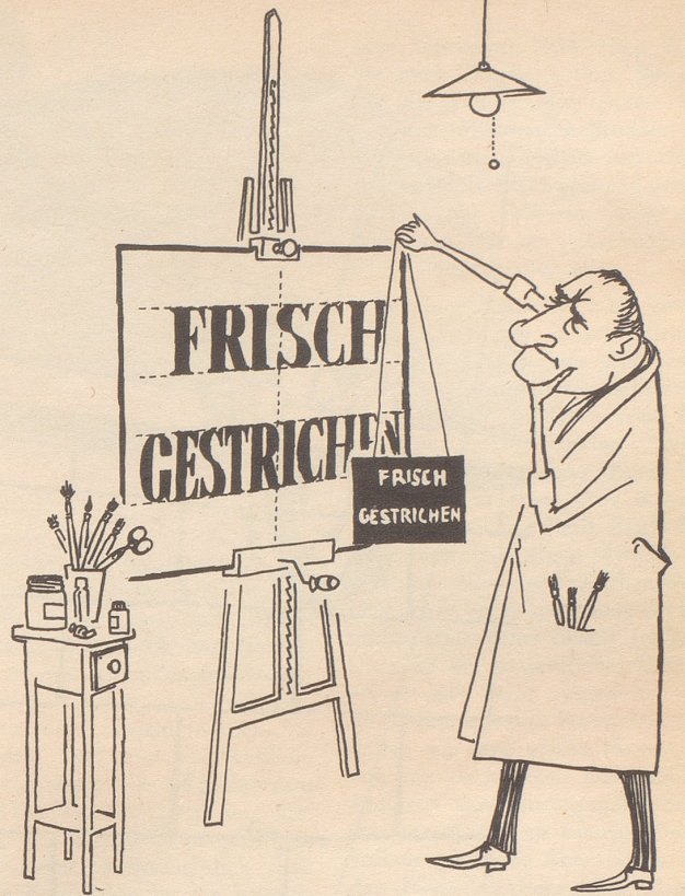
Der vollkommen Vorsichtige