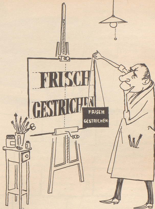
Der vollkommen Vorsichtige