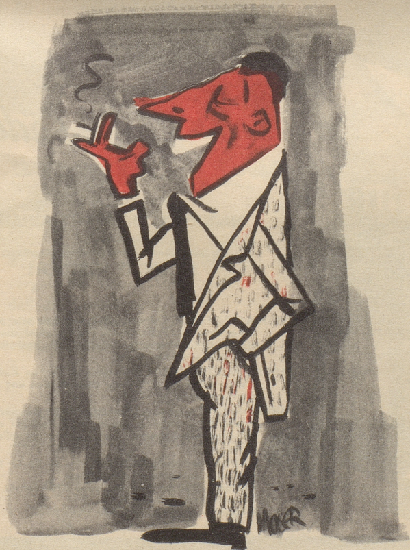
Der Mann, der a) in den Ferien braungebrannt wurde und b) es weiß.