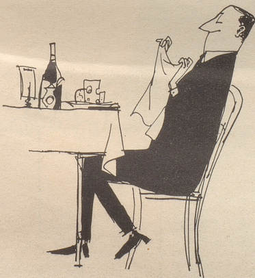
Bild ohne Worte

(Es ist eine kleine Käseplatte: Emmentaler, Tilsiter und Greyerzer. Verlangen Sie den gepflegten Käse im Restaurant oder bei Ihrem Käsehändler.)