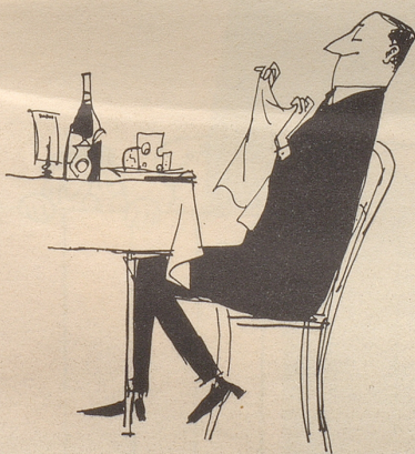
Bild ohne Worte

(Es ist eine kleine Käseplatte: Emmentaler, Tilsiter und Greyerzer. Verlangen Sie den gepflegten Käse im Restaurant oder bei Ihrem Käsehändler.)