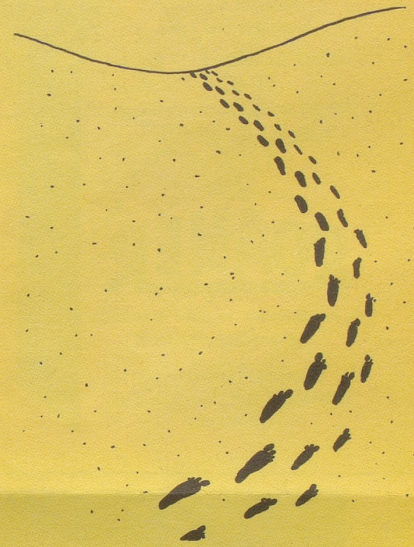
Eine Liebe, die im Sande verläuft