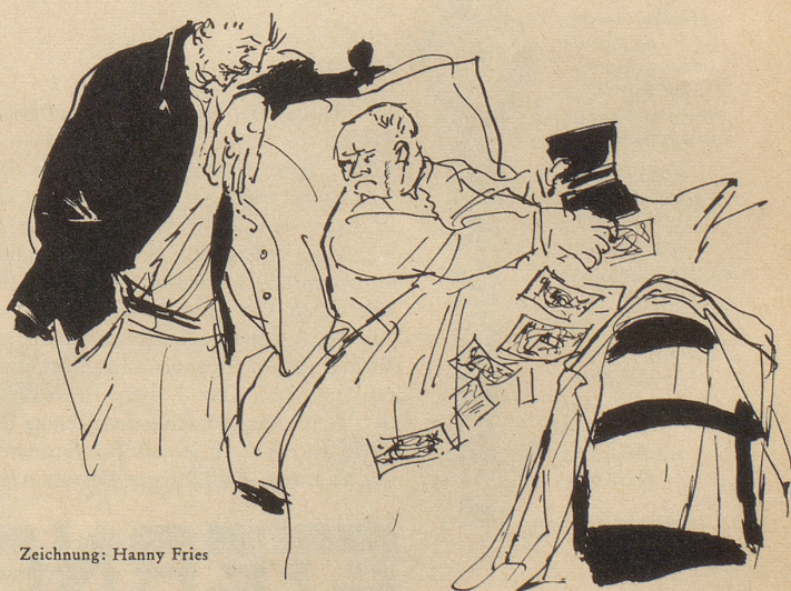
Zeichnung: Hanny Fries