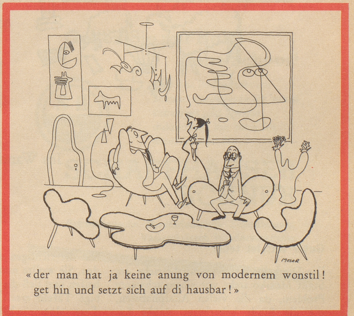
«der man hat ja keine anung von modernem wonstil! get hin und setzt sich auf di hausbar!»

Eine reiche Dame der New Yorker Gesellschaft hinterließ ihrem irischen Dienstmädchen den Betrag von 12000 Dollar – «damit auch sie wie eine Dame leben und sich ein Mädchen halten kann, um mit ihm ihre tägliche Aufregung und ihren Aerger zu haben.» Sam