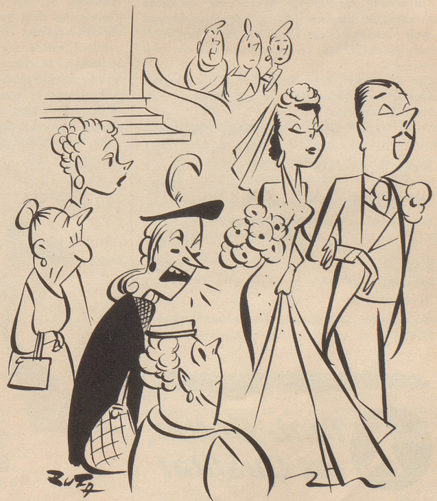
Klatsch « Ein ideales Brautpaar, sie ausgenommen! »