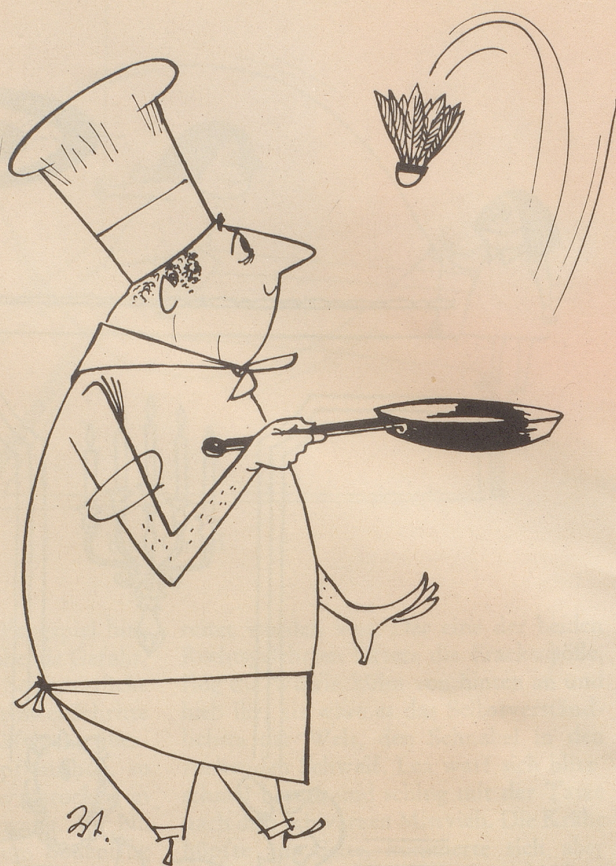
Das Kind im Manne