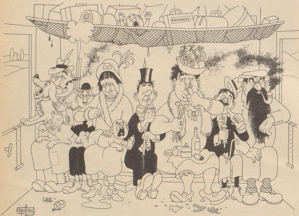
Ein Glück, daß es air-fresh gibt