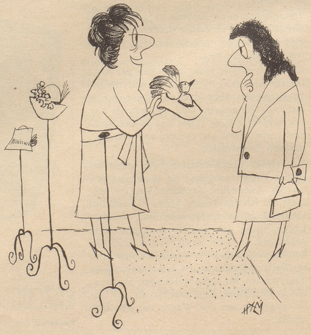
«Und das isch euse Schlager, s Vögeli cha pfiiffe!»

Das italienische Institut zur Erforschung der öffentlichen Meinung unternahm eine Untersuchung darüber, was der durchschnittliche Italiener als Glück- und Glücksquellen angibt. Auf die Frage nach der hauptsächlichsten Freudenquelle gingen folgende Antworten ein: Familienfreuden und Familienleben: 21 % Geburt eines Kindes: 11 % Liebe: 9 % Erst nachher folgen: guter Geschäftsgang, unverhoffter Gewinn, Freundschaft, Sport, Alkohol usw.