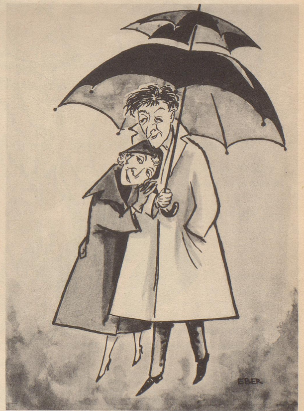
Aus unserer Erfindermappe Lösung des Schirmproblems der Verliebten