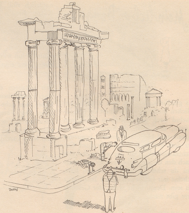
Sehenswürdigkeit in Rom