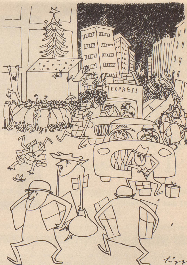
--- Betriebsamkeit auf Erden ---