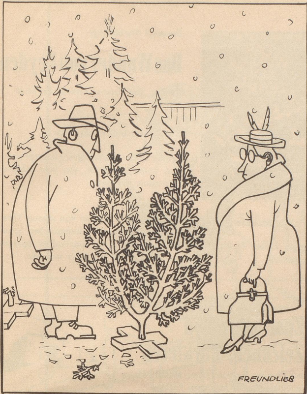
«s isch für es Doppelzimmer Madamm!»