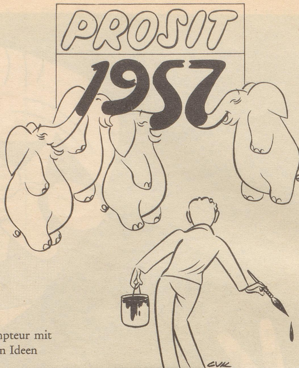
Dompteur mit neuen Ideen