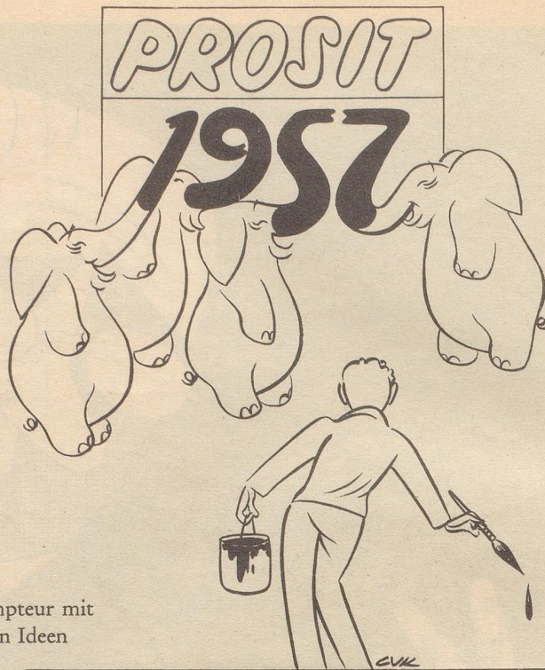
Dompteur mit neuen Ideen