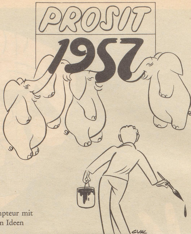
Dompteur mit neuen Ideen