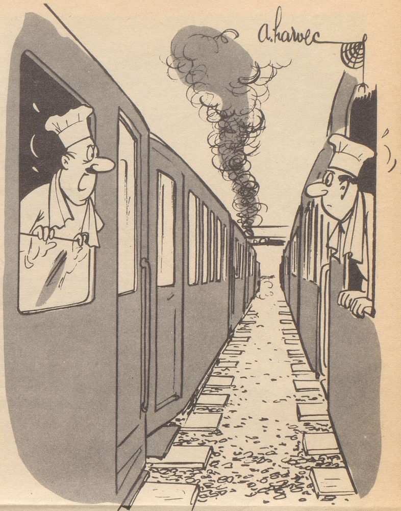
Speisewagen kreuzen sich

könnte man die folgende wahre Geschichte nennen. Der frühere amerikanische Soldat McHale stand vor dem Polizeirichter in Montreal, weil er angeblich versucht hatte, durch ein Fenster in die Wohnung einer Dame einzusteigen. Mit einem Schreckensschrei war die Dame zurückgefahren, als sie den unbekanntenen Mann im Fenster erblickte, der sich anschickte, sich in ihr Zimmer zu schwingen, und hatte die Polizei alarmiert. Im Verlauf seiner Verteidigung, die durch seine Freundin bestätigt wurde, gab McHale bekannt, daß er keineswegs einen Einbruch geplant hätte. Er wollte nur nach längerer Abwesenheit von Montreal wieder sein Girl besuchen und seitdem er in Bayern das «Fensterln» gelernt hatte, praktizierte er seine Besuche nur auf diesem Wege. Inzwischen hatte aber seine Freundin die Wohnung gewechselt und so hatte er sich einer wildfremden Dame gegenüber gesehen, die ihrerseits an seinen ehrlichen Absichten gezweifelt hatte. Michel