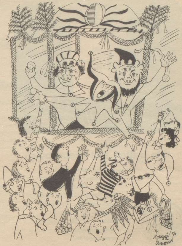
Luzern im Februar