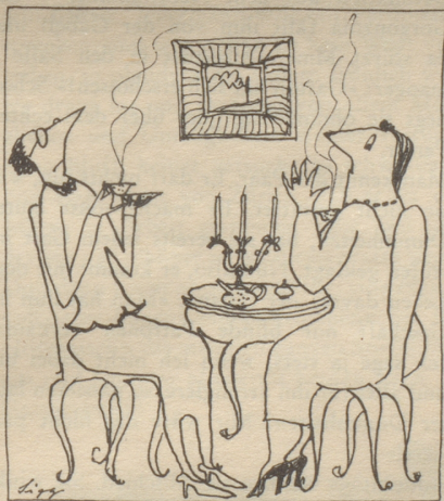
«Hüt chönnt sonen Mozart doch Gält verdiene!»

Zu der Meldung, daß in den Abbruzzen ein Rudel Wölfe in eine Schafherde eingedrungen sei und 30 Schafe aufgeessen habe, ließ sich eine menscheitsfreundliche Zeitung des Kantons Z. den Titel einfallen: «Wölfe spüren Lust auf Schafvoressen.» GP