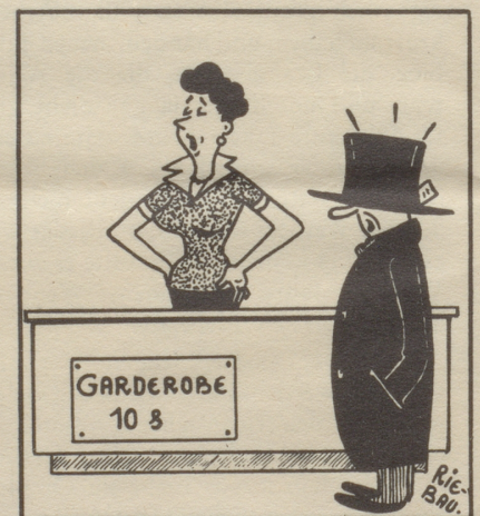
« Si sind de letscht Gascht und das isch de letscht Huet! »

wunderung temperamentvoll Luft schaffen: «E settige gseet me bi üs höchstens au Schautjaar einisch! – Settig würd me z Bärn usschstelle! – Ja ir Schwiz isch me haut scho nid mit schöne Manne verwöönt!» Da bricht die Woge der Begeisterung unerwartet ab. Der traumhafte Caballero hat zu seinem Begleiter einige Worte gesprochen in einer Sprache, die den drei Mädchen eigentlich gar nicht so spanisch vorkommt. «Dir», platzt Rösli aufgeregt heraus, «dasch ja e Franzos!»