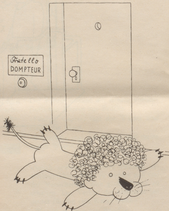
Cäsar muß Türvorlage spielen