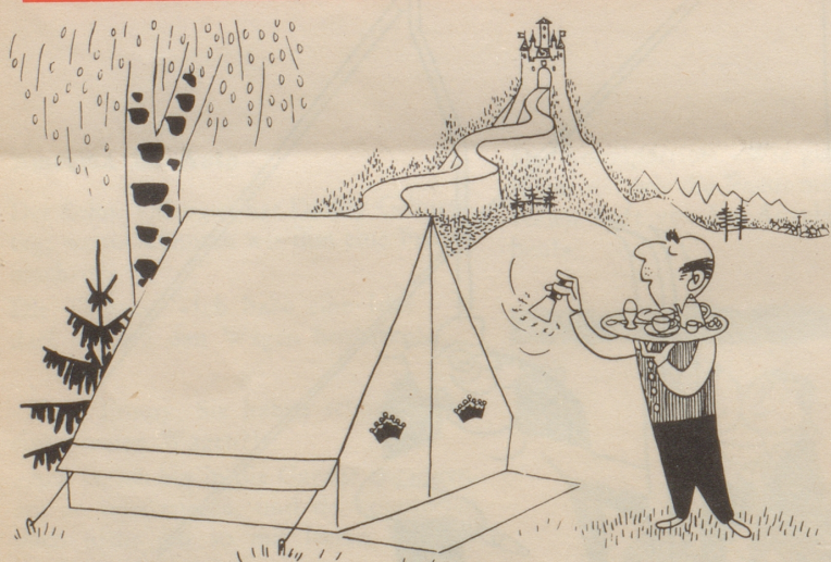
Camping, des Grafen Leidenschaft