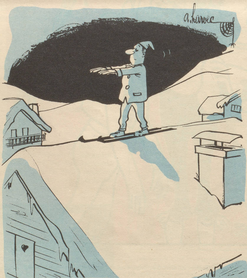
Der schlafwandelnde Wintersportgast

Aus einer Rede Harun al Raschids, des Kalifen von Bagdad, gehalten im Jahre 750 der Hedschra, im Senat von Damaskus: «... und der weise Mann widerspricht nur im äußersten Notfall! und wenn er mit seiner Gattin spricht, widerspricht er ihr sowieso nicht; und wenn er vierhundert Frauen hat, so widerspricht er vierhundertmal nicht! Und wenn er nur eine einzige hat, so soll er dafür doppelt dankbar sein, und wenn diese ihm sagt, kauf mir einen Orientteppich, so soll er eilen, zu Vidal an der Bahnhofstraße in Zürich, dort kriegt er ihn erst noch billig!»