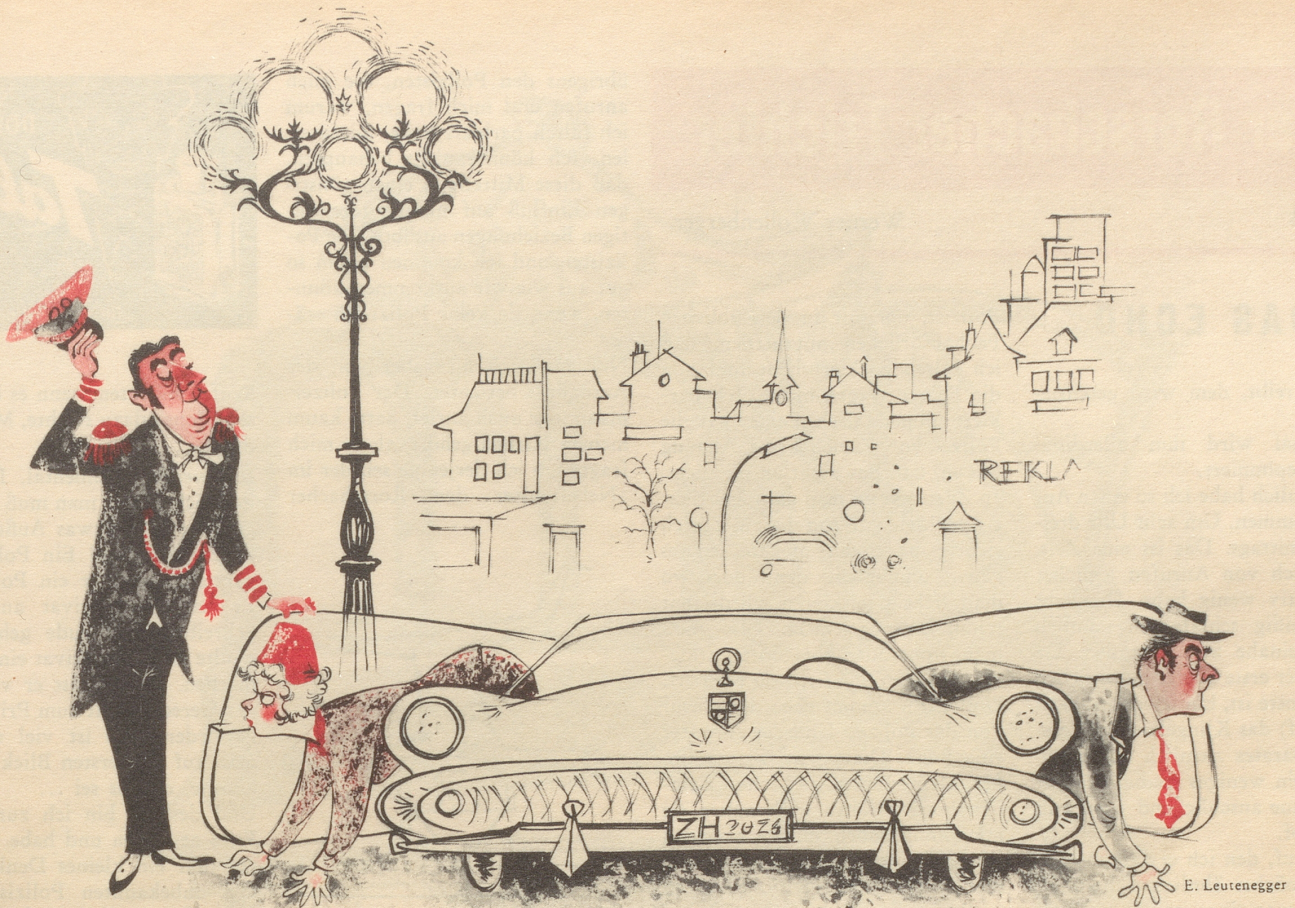
Die neue Linie