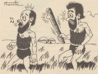
Früener händs na härti Grind ghaa!

Man liest gelegentlich in Selbstbiographien: «Ich habe in meinem Leben über hundert Bilder gemalt (Novellen geschrieben, Sonaten komponiert, usf.), und vielleicht drei, vier davon waren gut.» Wie rührend bescheiden! «Nein!» ist man versucht, den Leuten zuzurufen, «viel mehr von dem, was Ihr geleistet habt, ist gut!» – Und damit habe ich genau die Weise gepfiffen, die sie mit ihrer Aussage hervorlocken wollten. Denn Sprüche erzeugen Wider-Sprüche. Bums