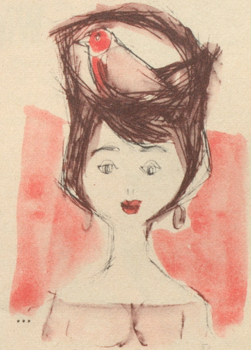
Vignette: W. Christen

Warum nicht? Soll er sich vielleicht besser mit einer Teppichreinigungsanstalt verheiraten oder mit einer patentierten Küchenschürze? Sind die vogelsicherer? Ich glaube kaum. Nur die Art der Vögel wechselt.