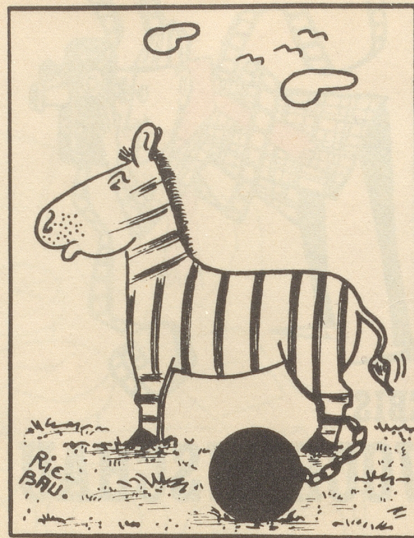
«Und das nur wegen den blöden Streifen!»

Und wenn meine Freunde meinen: Sieh, ein Garten rentiert doch heute nicht mehr; man kauft doch alles im Laden. So sage ich: Momänt! Das Glück kauft ihr nirgends. Habt ihr gesehen, wie die Lupinen nun schon erblühen? Mathis