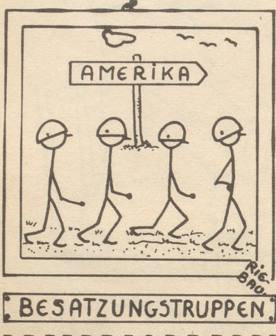
« Abzieh-Bild »