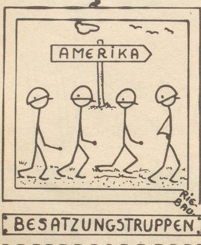
« Abzieh-Bild »