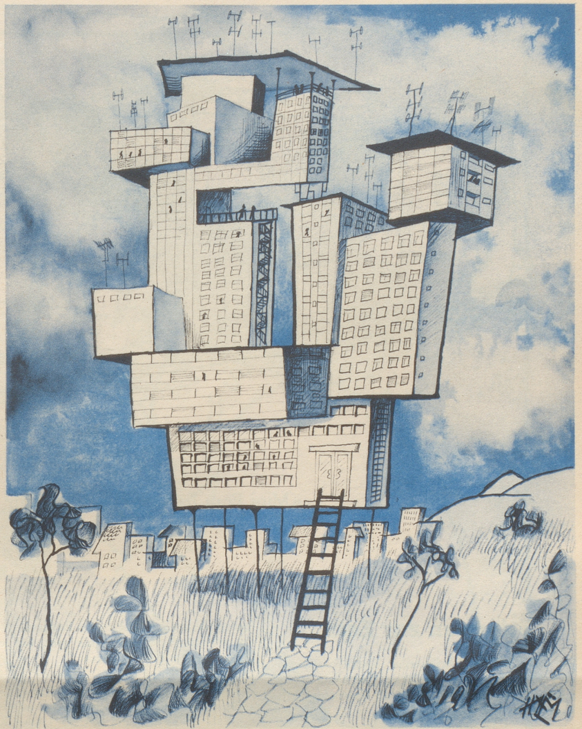
Blick in die Zukunft

Hauptquartier. Der Opernkönig mehrt den Ruhm der Heimat – im Ausland. Aber zu Hause ist man unzufrieden. Primadonnen melden sich krank, Tenöre verunglücken in den höchsten Regionen, die misera plebs der Stammabonnenten murrte, die revolutionäre Stehplatz-Jugend gerät in Bewegung, die Hofkamarilla intrigiert gegen den Monarchen, die Presse läßt es sich nicht nehmen, den strahlenden Helden im Druck anzuschwärzen ... Damit ist jener Zustand erreicht, der mit der Krönung des vazierenden Dirigenten zum Opernkönig offenbar angestrebt wurde. Der permanente Opernskandal schafft jene Atmosphäre, in der wahre Kunst erst aufblüht. Die randalierende Koloratursubrette, der intrigierende Bariton-Bösewicht, der heisere Heldentenor: das gehört nicht nur zum Bühnenbetrieb der Oper, sondern auch zum Alltag des Operngeschäfts. Die Drohung mit der Demission – das ist die feste Grundlage des festen Opernherrschers. Denn das ist das Wun-