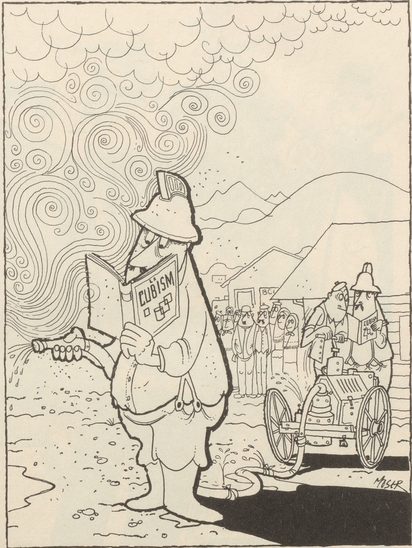
Nach englischen Pressemeldungen läßt die Unesco in St-Sulpice (Frankreich) den Feuerwehrmännern Unterricht erteilen in kubistischer Malerei.

So beschränkte ich mich darauf, die Ingenieure zu beobachten, die nach und nach das Frühstückszimmer zu füllen begannen, und ich stellte fest, daß es sich in der über-