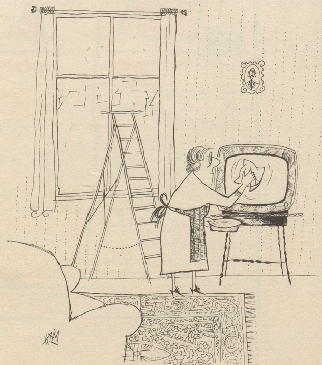
«nüt als mee Arbet häpme mit dem moderne Züg!»