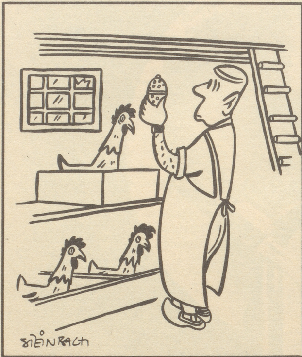
«Wieso ächt es Tee-Ei?»