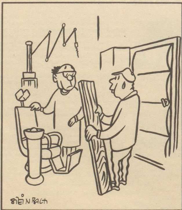
«Chönnted Si mir gschnäll es Loch dur das Brättli dure bore.»