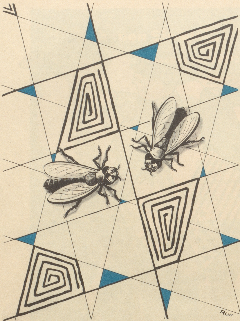
«Chum mer haue ab, die modärni Tapete macht mi ganz nervös!»