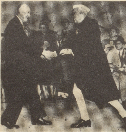
Premierminister Jawaharlal Nehru ist in Washington eingetroffen und wurde auf der Treppe des Weissen Hauses von Präsident Eisenhower herzlich begrüsst.