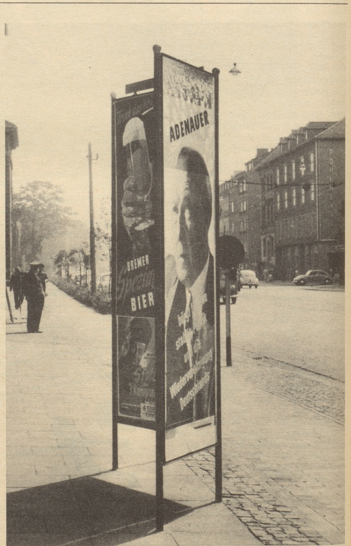
Adenauer feiert das Wahlergebnis