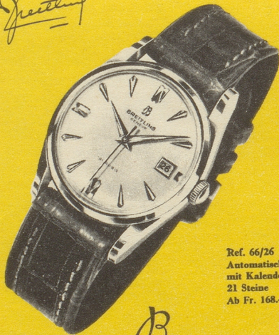
Ref. 66/26 Automatisch mit Kalender 21 Steine Ab Fr. 168.—