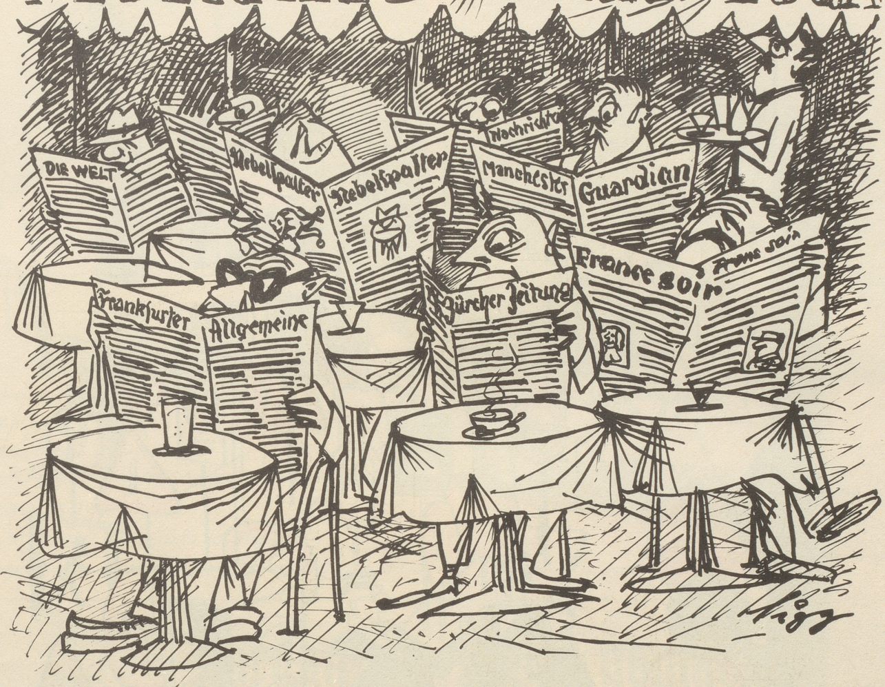
Schweizer und Fremde im Tessin, aber im Kontakt mit der Heimat