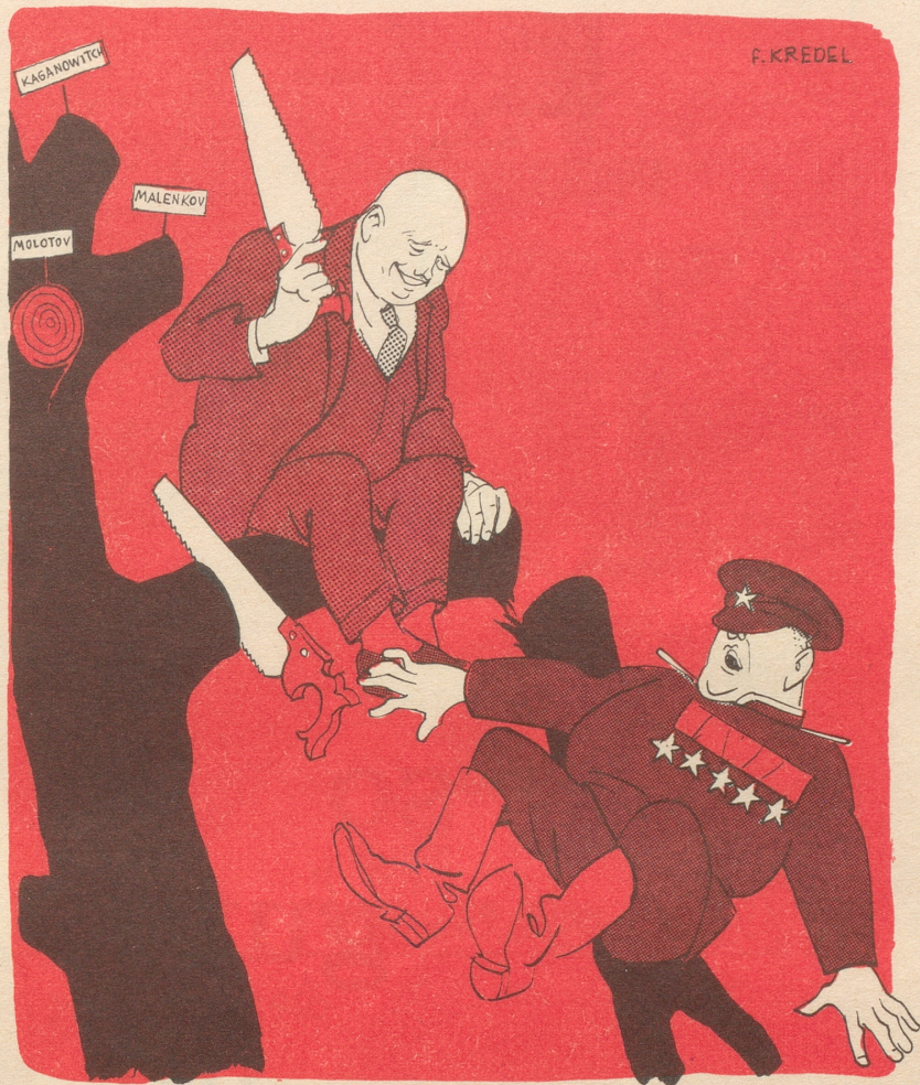
Chruschtschew der Sieger

PS. Nicht jeder Doppelgänger wird dazu verurteilt, ein Blindgänger zu sein! Da gibt es in Rußland einen Schauspieler, der viele Jahre lang Erfolge und Spitzengagen einstrich. Nicht wegen seines überragenden Ta-