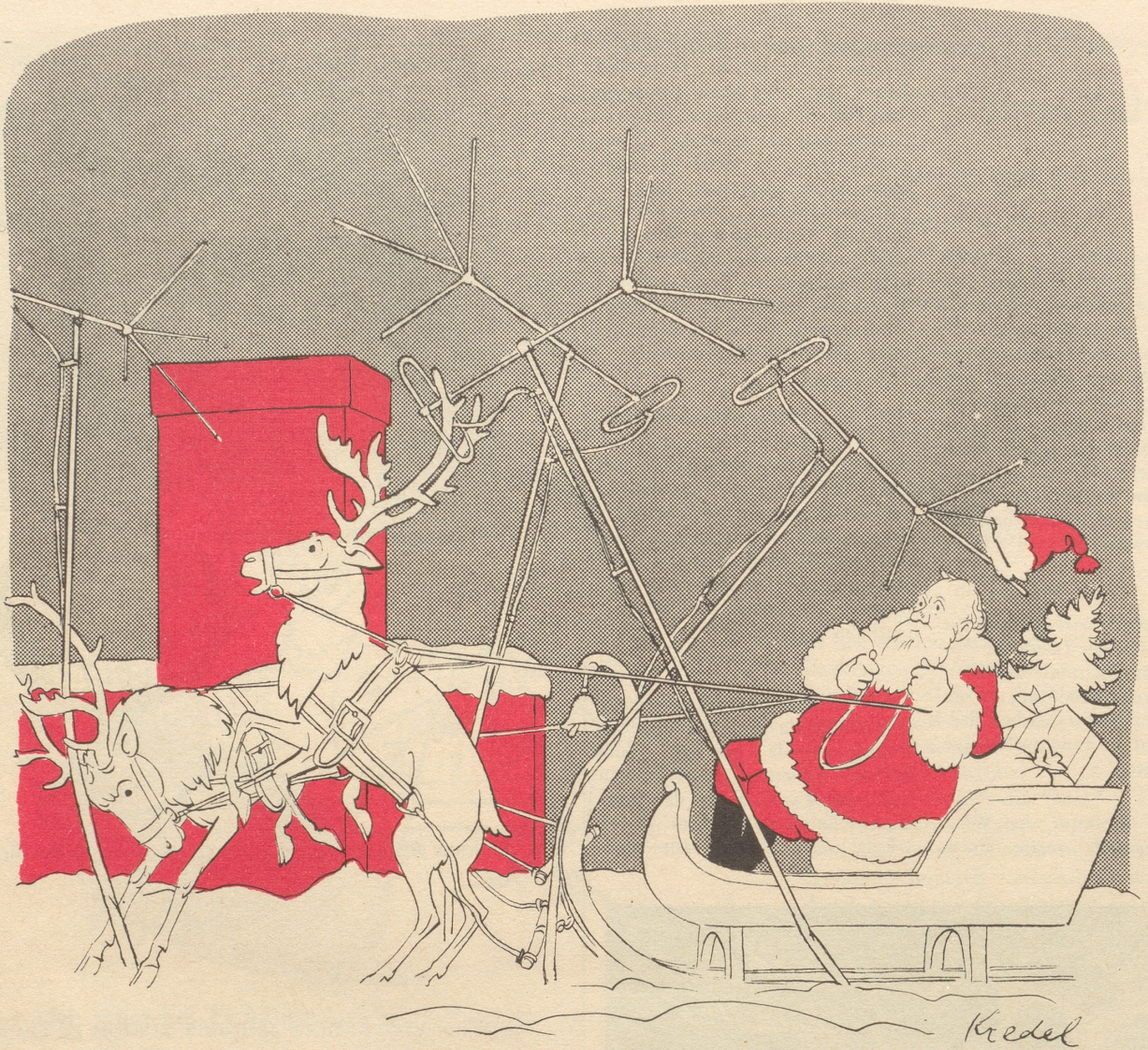
Die Landung wird immer schwieriger!