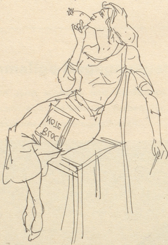
Ein Büchlein für und über unsere lieben Frauen