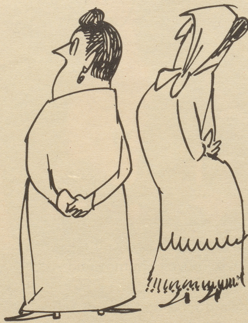
«Nüdemal Grüezi sait er eim!»